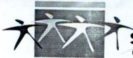
Antônio Augusto Aragão Junior Prefeito Municipal

Santa Rita de Cássia/Ba., 28 de março de 2007.