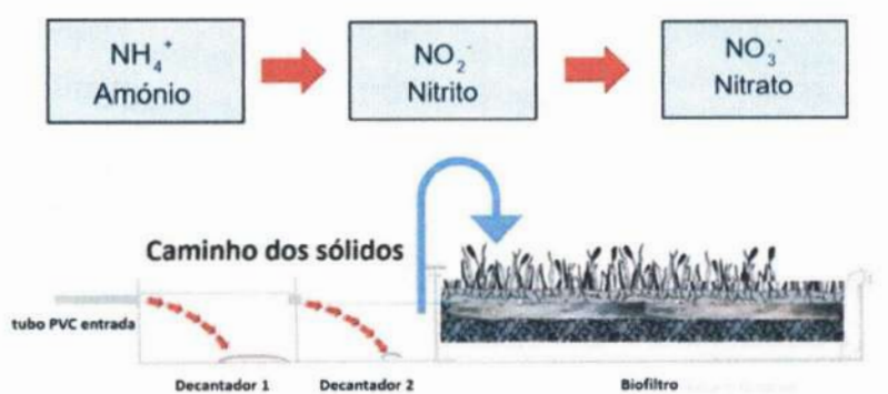
IMAGEM 3: Processo de Nitrificação.

Após o biofiltro, a solução passa para o equalizador, reservatório da última etapa da filtragem, para volatilização de CO 2 , através das plantas aquáticas em sua superfície. E nele onde ocorre a mistura da solução provinda do biofiltro com a água de abastecimento.