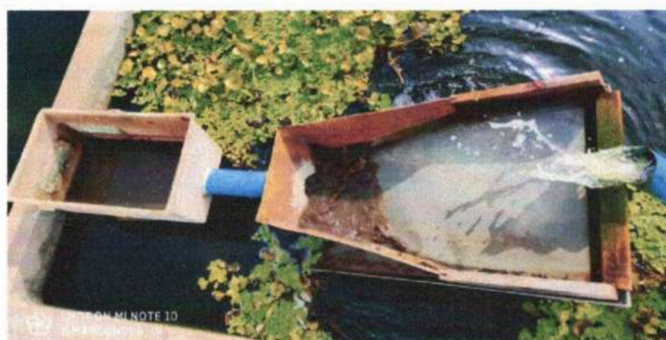
IMAGEM 2: Filtragem, Piscicultura Macedo, Xique-Xique-Bahia.

O biofiltro ou filtro biológico, é um componente chave na porção de filtração de um Sistema de recirculação de água. A eficiência na redução da concentração da substância poluente ou indesejável, depende diretamente da composição do biofiltro. Para um sistema de filtragem funcionar adequadamente é preciso que o biofiltro seja muito bem dimensionado. O caminho percorrido pelos sólidos que vem dos tanques, inicia no decantador, que é a primeira porção, passa por um filtro com uso de uma tela de aço inox com caixa de coleta dos dejetos, o filtro reduz cerca de 90% dos sólidos decantáveis (IMAGEM 2), no decantador soluções de 100 micras ou maiores são decantadas, depois passa para um segundo decantador com uma menor quantidade decantada no fundo. As soluções de 100 micras passam por tubulação com furos e feita descarga diariamente, as soluções entre 100 a 40 micras passam para o biofiltro (também chamada de zona de raiz), e no biofiltro ocorre reações de amônia até nitrato.